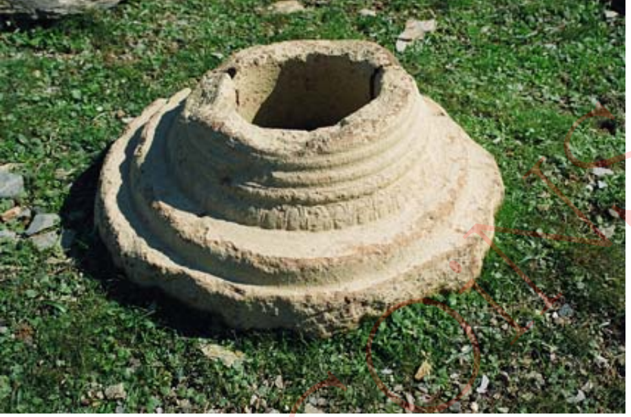
Resim 6: Pişmiş toprak sütun altlığı