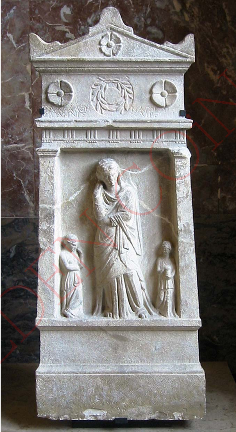
Resim 8: Oroanna'lı Thalea'nın mezar taşı (Louvre)