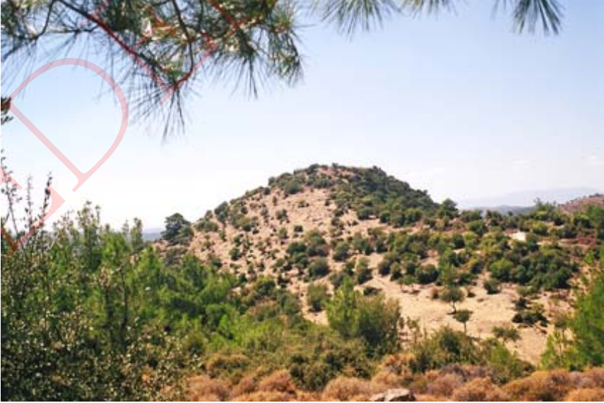
Resim 1: Kocadümen Tepe Güneyden