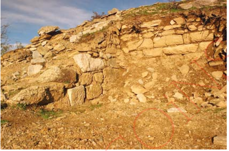
Resim 4: Pers yıkımı sonrası tamir görmüş duvarlardan detay