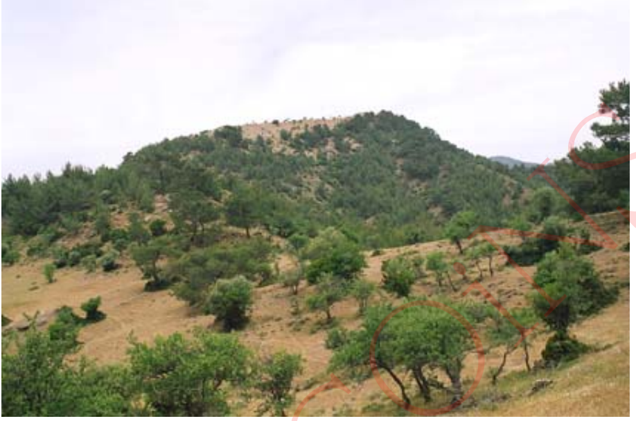
Resim 2: Kocadümen Tepe Kuzeyden