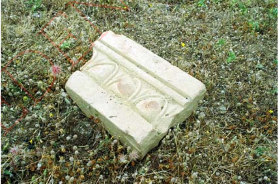
Resim 5: Pişmiş toprak duvar kaplama malzemesi