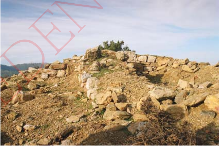
Resim 3: Kaçak kazılar sonucunda tahrip edilen duvarlardan detay